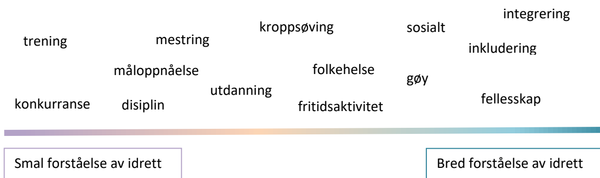
Figur 1: Forståelsen av idrett

Kategori 1 handler om hvilken forståelse av idrett som ligger til grunn for casene vi har studert. Altså, ønsker vi å si noe om idrettsaktiviteten inkluderer tradisjonell konkurranseidrett og målrettet trening, eller om aktiviteten bærer mer preg av andre elementer som for eksempel idrettens sosiale, helsemessige eller inkluderende rolle. Figuren under kan illustrere noen rasjonale for å arrangere eller delta i idrettsaktivitet og kan vise den brede forståelsen av hva idretten er eller kan være: